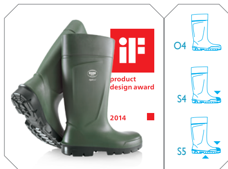
Agrilite® - ref. P2100/9180 (O4) ref. P2300/9180 (S4) - ref. P2400/9180 (S5)